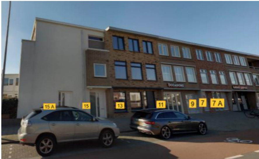
Figuur 1: locatie