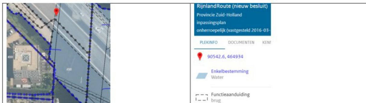
Figuur 3: Uitsnede bestemmingsplan "RijnlandRoute (nieuw besluit)"

De beoogde ontwikkeling is ten dienste van het land en niet van het water, daarmee is de steiger/vlonder in strijd met het bestemmingsplan.