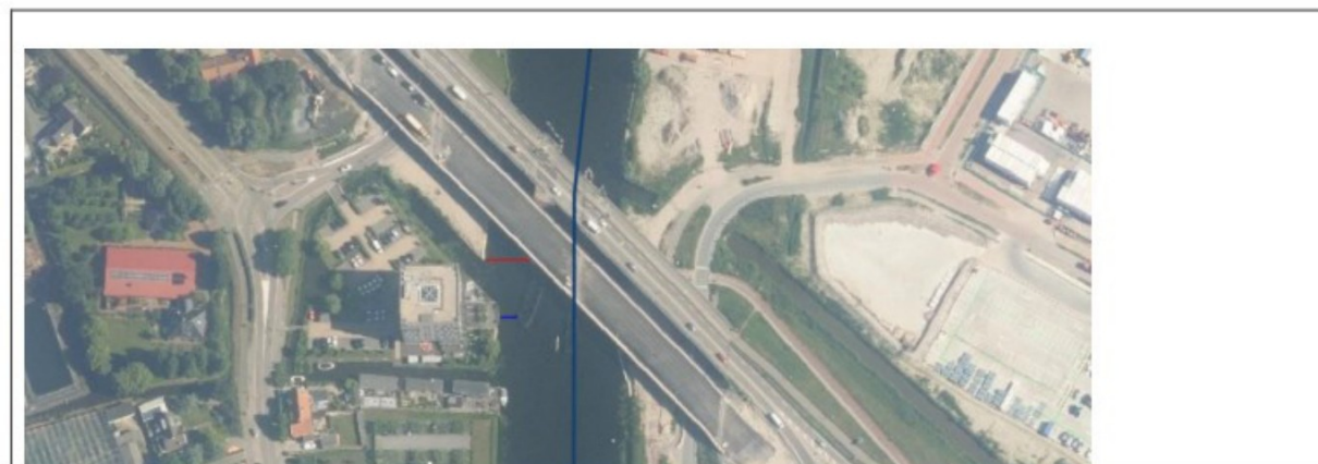
Figuur 4: Uitsnede"

Er blijft een acceptabele doorvaarbreedte met de realisatie van de beoogde steiger/vlonder.