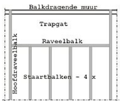
Bovenaanzicht van een gedeelte van een balklaag met een trapgat.

Zoals te zien is in het overzicht van de bezochte bijgebouwen met prioriteit (zie bijlage AA ) zijn er een aantal niet veilig, echter deze veiliger maken kan ingrijpend zijn. De trap is bij een calamiteit een wezenlijk onderdeel van de vluchtweg. Die veilig beloopbaar maken heeft nogal wat consequenties. Het verbreden naar de minimale breedte van 0,70 meter, het aanpassen van de steilte (minder steil maken), het aanhouden van een minimale afmeting voor aan- en optrede of het aanhouden van een minimale vrije ruimte boven de traptreden tot aan een balk of plafond, zorgen er voor, dat het trapgat aanzienlijk vergroot moet worden, waardoor het minimaal aanwezige vloeroppervlak voor bewoning misschien niet wordt gehaald, dit betekent overbewoning. Om dan een veiliger bijgebouw te verwezenlijken, moeten er ook constructieve wijzigingen in de vloer worden aangebracht met een langere raveelbalk en verdubbeling van de hoofd raveelbalken.