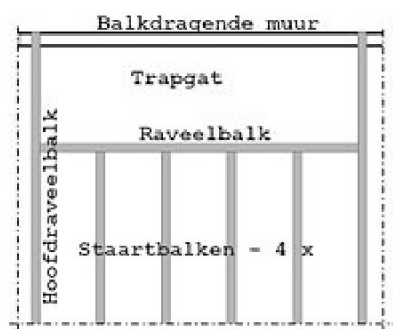
Bovenaanzicht van een gedeelte van een balklaag met een trapgat.

Zoals te zien is in het overzicht van de bezochte bijgebouwen met prioriteit (zie bijlage AA ) zijn er een aantal niet veilig, echter deze veiliger maken kan ingrijpend zijn. De trap is bij een calamiteit een wezenlijk onderdeel van de vluchtweg. Die veilig beloopbaar maken heeft nogal wat consequenties. Het verbreden naar de minimale breedte van 0,70 meter, het aanpassen van de steilte (minder steil maken), het aanhouden van een minimale afmeting voor aan- en optrede of het aanhouden van een minimale vrije ruimte boven de traptreden tot aan een balk of plafond, zorgen er voor, dat het trapgat aanzienlijk vergroot moet worden, waardoor het minimaal aanwezige vloeroppervlak voor bewoning misschien niet wordt gehaald, dit betekent overbewoning. Om dan een veiliger bijgebouw te verwezenlijken, moeten er ook constructieve wijzigingen in de vloer worden aangebracht met een langere raveelbalk en verdubbeling van de hoofd raveelbalken.