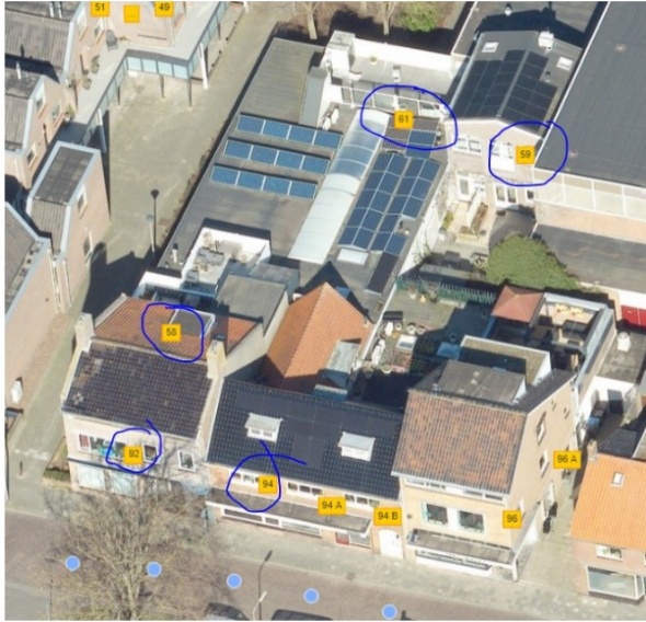
Figuur 1: Beoogde locatie