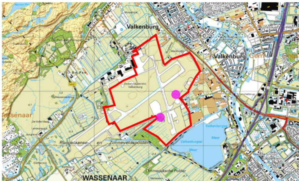
Figuur 1: Deelgebied grondstromen

Dit werkprotocol is bedoeld voor personen/bedrijven die met grondverzet en toepassing van grond te maken krijgen op het voormalig vliegveld Valkenburg. De Nota Bodembeheer en de Bodemkwaliteitskaart/functiekaart van de gemeente Katwijk (ZH), alsmede de regels uit het Besluit bodemkwaliteit en de Regeling bodemkwaliteit en overige wet- en regelgeving zijn onverkort van toepassing op grondverzet en toepassing van grond. Dit werkprotocol is daarop een aanvulling.