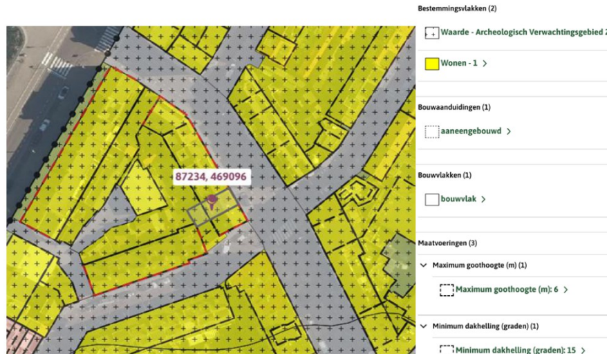
Figuur 2: Uitsnede bestemmingsplan "Katwijk aan Zee 2015"

Er vinden geen graafwerkzaamheden plaats waardoor er geen advies benodigd is van afdeling Archeologie.