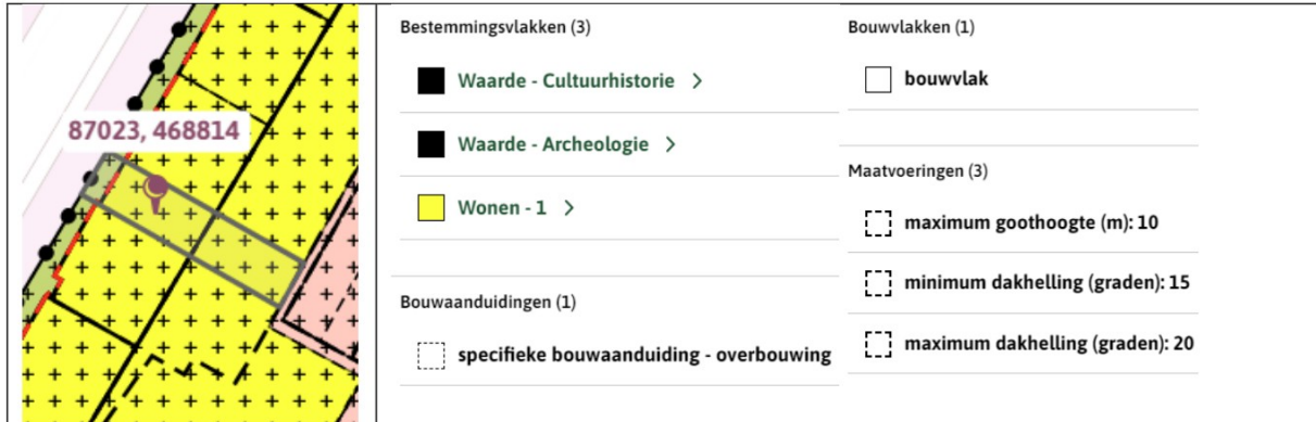
Figuur 3: Uitsnede bestemmingsplan "Katwijk aan Zee 2015"

Er kan niet worden voldaan aan de binnenplanse afwijkingmogelijkheid, omdat de maximale oppervlakte conform lid b wordt overschreden met 8,5m 2 .