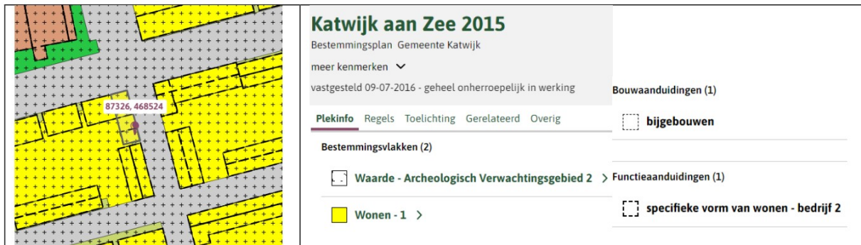
Figuur 3: Uitsnede bestemmingsplan "Katwijk aan Zee 2015"

De beoogde ontwikkeling voldoet aan de binnenplanse afwijkingmogelijkheid.