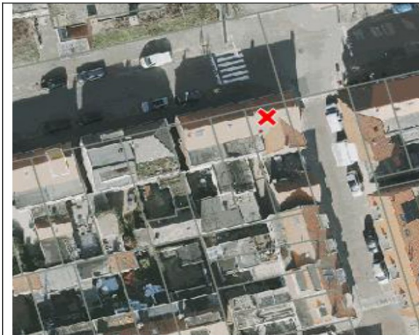
Figuur 1: Beoogde locatie

De aanvraag betreft het gedeeltelijk toeristisch verhuren van de woning (B&B) aan de Secr. Varkevisserstraat 121 te Katwijk.