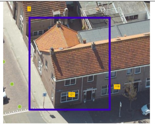
Figuur 2: Beoogde ontwikkeling